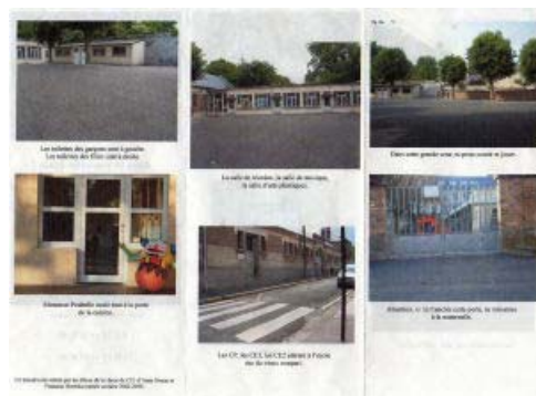
Le document final (verso)