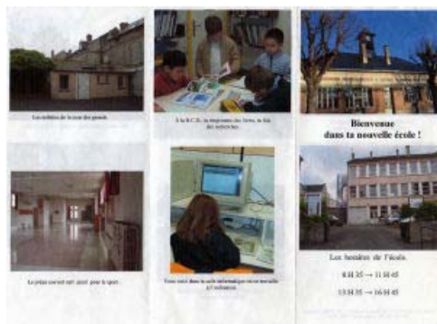
Le document final (recto)

La première maquette est maintenant prête et présentée à toute la classe. On y apporte des modifications. Le travail est repris puis le document final est enfin prêt.