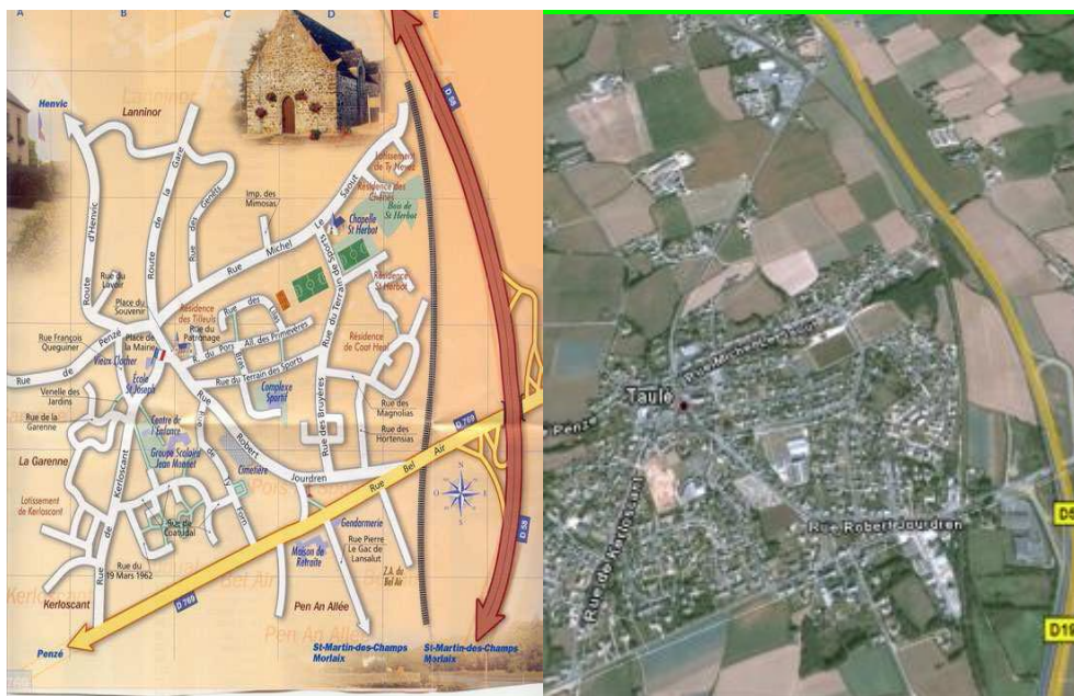
Mise en relation d'un plan de la commune et de la photo aérienne : orientation, axes principaux, rues, lieux.