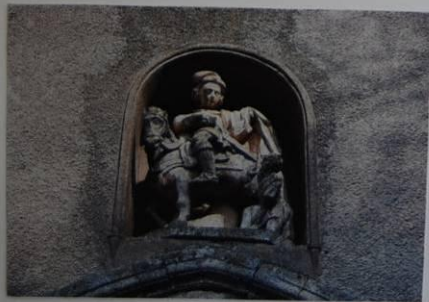
statue de Saint-Martin

Au-dessus de la porte, dans une niche pour se protéger de la pluie il y a une statuette de saint Martin. Il n'a pas d'habits romains car cette statue a été faite au 15 e siècle. On le voit quand il a coupé son manteau en deux et l'a donné à un pauvre.