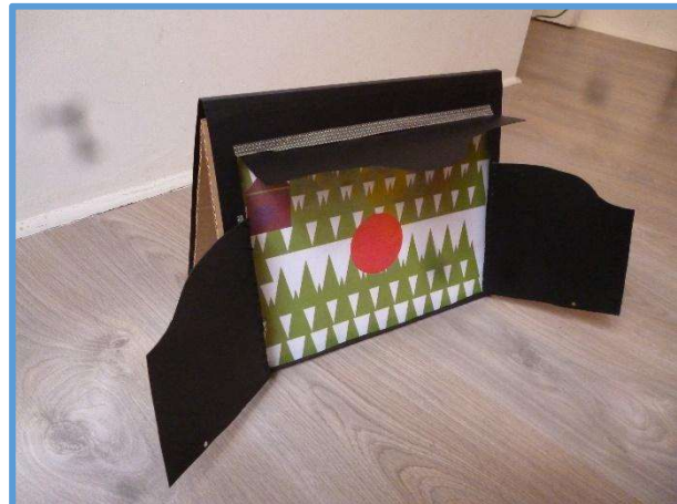
Insérer du carton à l'intérieur pour renforcer et glisser les pages