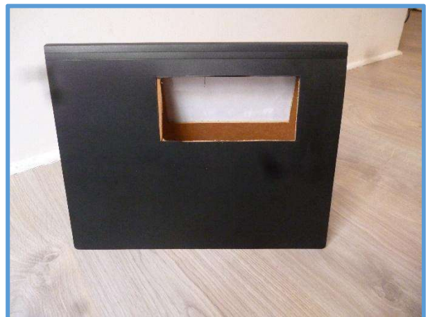
Découper un cadre pour lire le texte