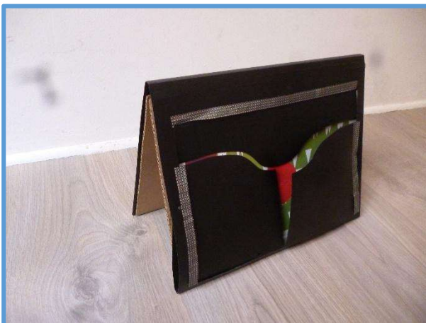
Découper puis recoudre les portes sur la pochette