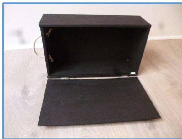
Fixer le panneau avant avec des chevilles