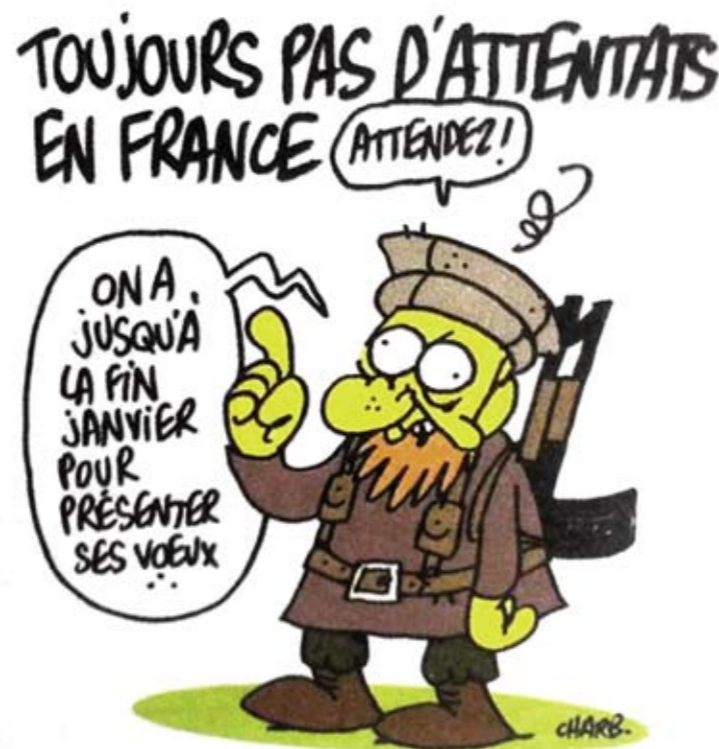
À gauche : Charb, le directeur de la publication de Charlie Hebdo , en 2011 après l'incendie criminel dont son journal avait été victime. À droite : son dernier dessin publié dans le magazine. Après l'attaque meurtrière de mercredi, il prend une terrible tonalité.